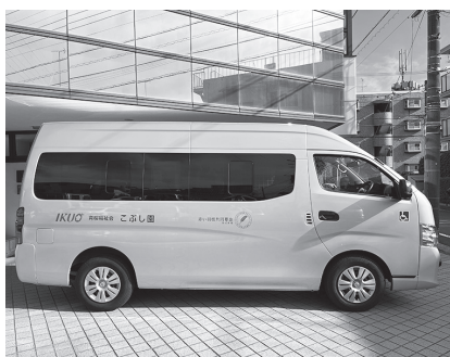
こぶし園購入車輛