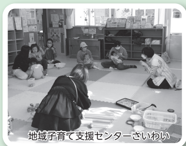
地域子育て支援センターさいわい