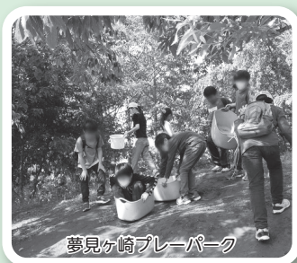
夢見ヶ崎プレーパーク

夢見ヶ崎プレーパークをつくる会は「ケガと弁当は自分もち」をモットーにした子どもの外遊びの場プレーパーク、ちびっこ版プレーパークおでかけ“ぽかぽか”と、地域子育て支援センターさいわい、おぐらの運営が活動の中心です。いずれも「子どものやってみたい!という気持ちを大事にし、ありのままの自分を受け入れられる場」であることを何よりも大切に活動しています。お子さんやお孫さんと一緒にぜひ遊びに来てください。