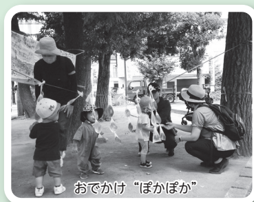
おでかけ“ぽかぽか”