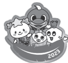
2023 川崎フロンターレ コラボデザイン

問合せ 神奈川県共同募金会川崎市幸区支会(幸区社協内) ☎044-556-5500