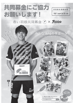
共同募金×川崎フロンターレポスター