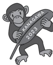
共同募金 PR 大使 野毛山動物園のチンパンジー「コウタロウ」