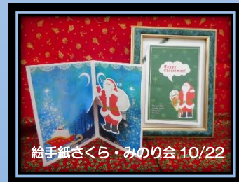
絵手紙さくら・みのり会 10/22