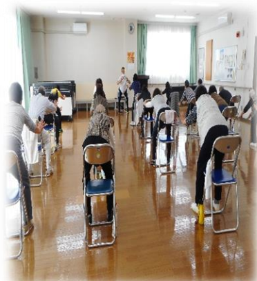
リフレッシュ体操