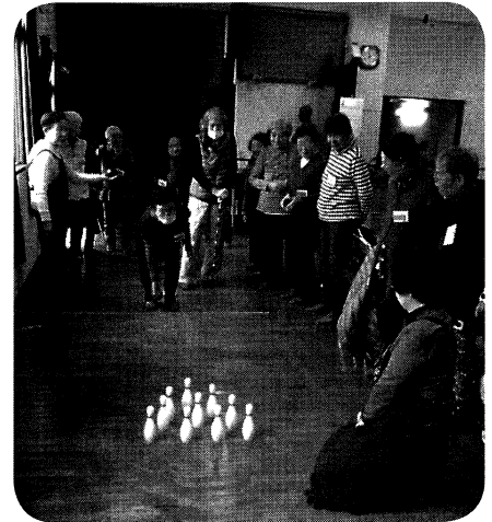
デイ・陽だまりっこ 赤組白組に分かれて