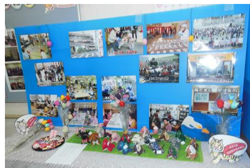
[区民祭にて活動紹介]