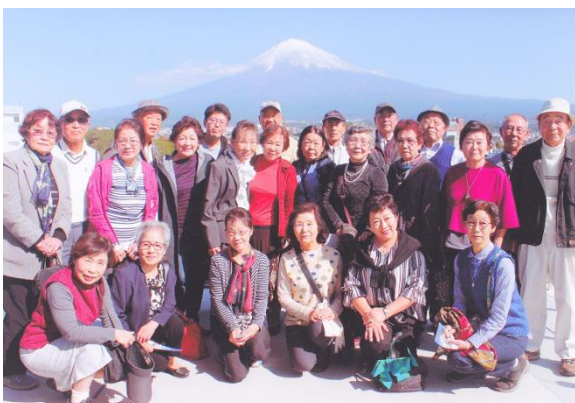
[ボランティア研修会]