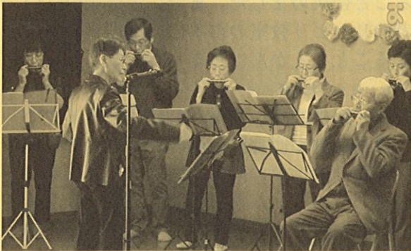
ハーモニカ〈コスモス〉

ヘルスメイトさんによる糖質や塩分を取り過ぎている現状や面倒と思わず健康のため自分で調理することや野菜をたくさん取ることの大