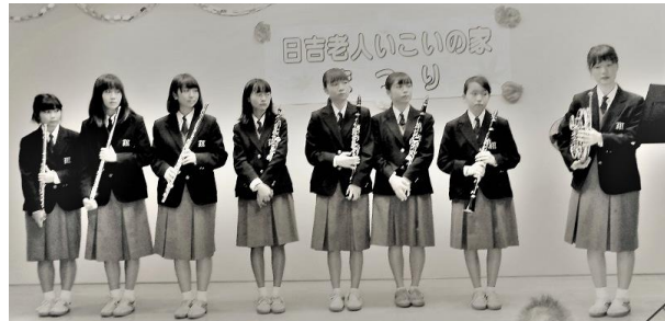
[南加瀬中学校吹奏楽部]