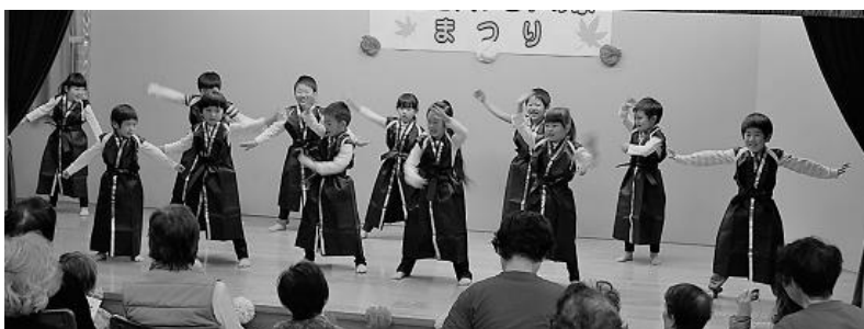
[ひびき保育園 園児]