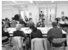
ボランティア交流会