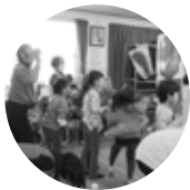
住民交流活動拠点

登録会員数1,394名 (27年度新規登録者176名) 年間利用者数 4,963名